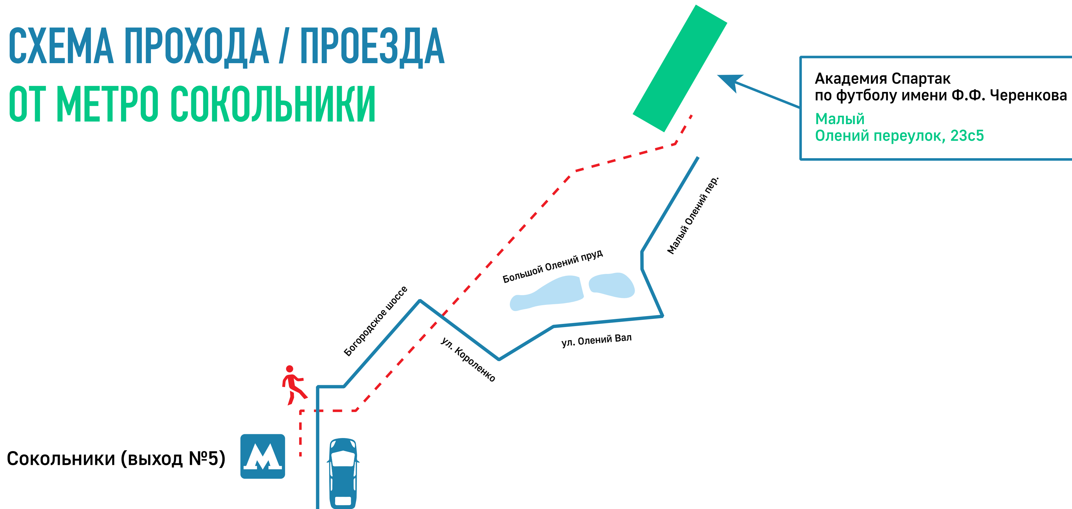
СХЕМА ПРОХОДА / ПРОЕЗДА ОТ МЕТРО СОКОЛЬНИКИ